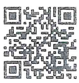
สิ่งที่ส่งมาด้วย ๑

กลุ่มส่งเสริมและพัฒนาด้านการกีฬาและนันทนาการ โทร./โทรสาร ๐ ๒๙๐๔ ๖๕๐๓ Email : saraban_Pathumthani@mots.go.th