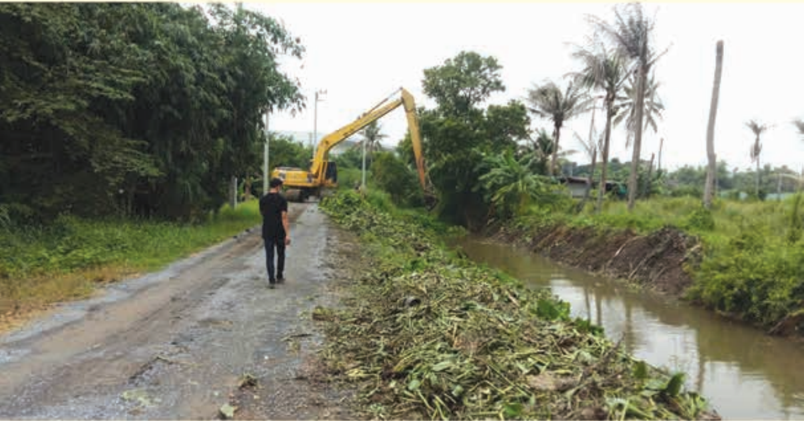
ดำเนินการขุดลอกวัชพืชที่กีดขวางทางน้ำ องค์การบริหารส่วนตำบลบ้านฉาง อำเภอเมืองปทุมธานี จังหวัดปทุมธานี